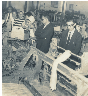
Máquinas da Fábrica de Tecidos Maranguape, em 1966