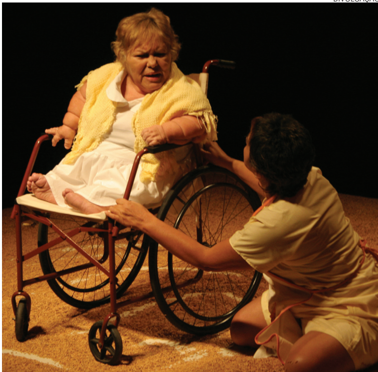
Cena do espetáculo Avental todo sujo de ovo , do grupo Ninho de Teatro

Criado pelo Serviço Social do Comércio (SESC) em 1998, o projeto cultural Palco Giratório percorre o País com o objetivo de democratizar o acesso às artes cênicas e fomentar a formação de plateia. Mais que isso, reúne anualmente uma amostragem importante da produção cênica brasileira, promovendo intercâmbios entre grupos nacionais e locais.