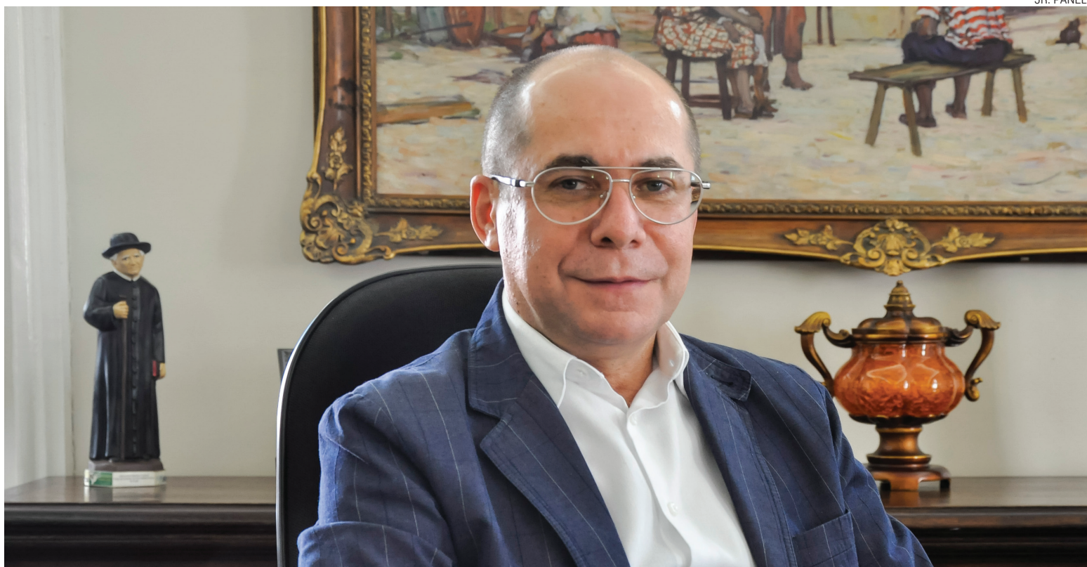
O Reitor aponta como principais legados a interiorização e a reestruturação acadêmica e administrativa da Universidade