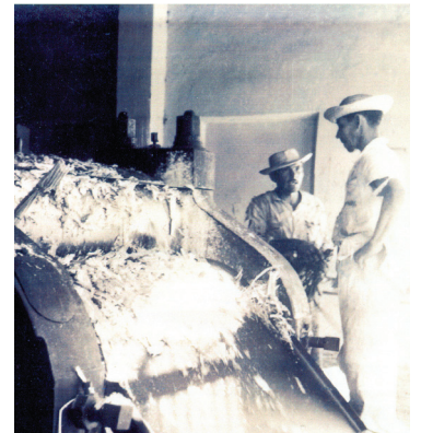
Terceiro engenho da Cachaça Colonial Maranguape, em 1966