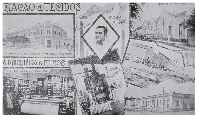
Cartaz publicitário de indústrias da década de 1930 em Fortaleza